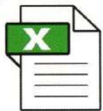
エクセルに読み込める CSVデータ