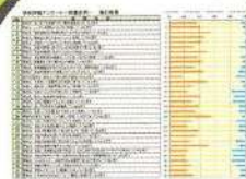
全生徒横棒積上グラフ