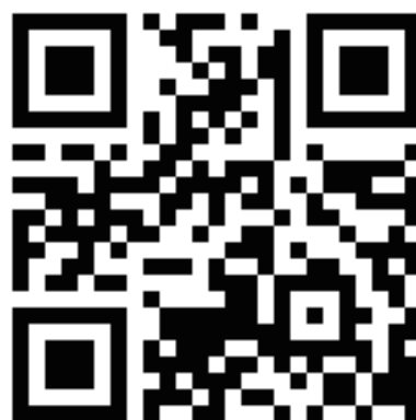
申込用 QR コード