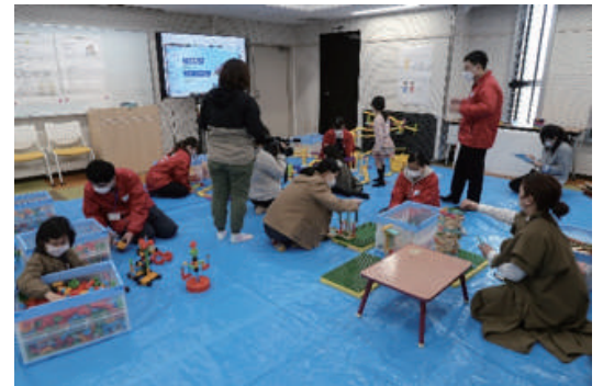
大学内でのデモ会場の様子 (2023)

復旧・復興の際、子どもの面倒を誰がみるのかという問題が発生します。しかし、子どもに目を向ける余裕がなくなってしまうのです。子どもの居場所問題の発生。